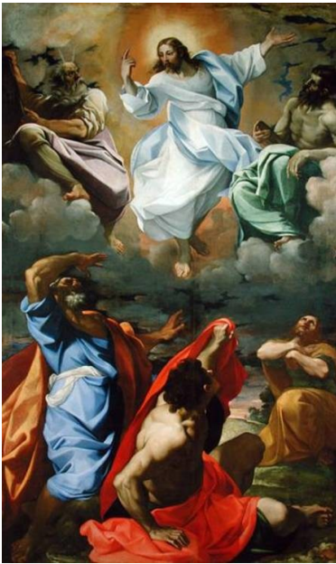
Door Ludovico Carracci (1555-1619).

Maak daarna samen een rondje en luister naar elkaars indrukken.